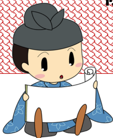
太子町マスコットキャラクター たいしくん

大阪府太子町山田の科長神社の夏祭りでは、大阪府内で唯一船だんじりが曳行されます。今回のスポット展示では、祭りと珍しい船だんじりの紹介を通して、地域に伝えられた歴史について考える機会とします。