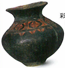
彩文土器 やまが 山賀遺跡 ((公財)大阪府文化財センター)