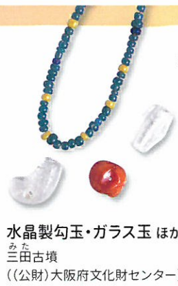
水晶製勾玉・ガラス玉 ほか みた 三田古墳 ((公財)大阪府文化財センター)