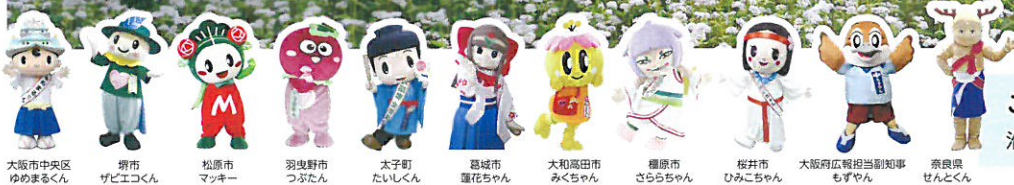
大阪府中央区 ゆめまるくん 堺市 ゼビエコくん 松原市 マッキー 羽曳野市 つぶたん 太子町 たいしくん 葛城市 蓮花ちゃん 大和高田市 みくちゃん 橿原市 さらちゃん 桜井市 ひみこちゃん 大阪府広報担当副知事 もずやん 奈良県 せんごくん