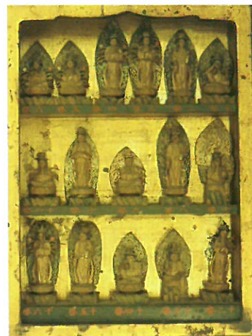
葉室組行者御背板 ミニチュア西国三十三所観音像／個人

展示では、これらの資料と太子町の西国巡礼の遺跡を紹介し、本年草創千三百年を迎えた西国巡礼と昨年日本遺産に認定された竹内街道をつうじて太子町の豊かな歴史にふれて頂く機会とします。